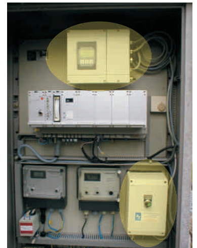
Messumformer und ZUB-POT/EMV Box im vorhandenen Schaltschrank integriert.