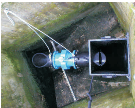
Perma-DiK System eingesetzt- warten auf Wasser.