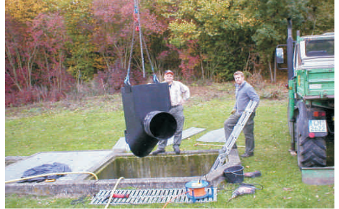
Perma-DiK Montageadapter beim einsetzen